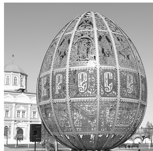
● 4-метровое пасхальное яйцо в Туле

На Пасху люди не только собирают семью за одним столом, но и дарят близким разнообразные подарки: пасхальные яйца, открытки и многое другое. Так, русские императоры дарили своим супругам особенные произведения искусства — ювелирные изделия мастера Фа-